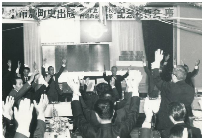
写真: 町史出版記念祝賀会(昭和 50 年 11 月 8 日)