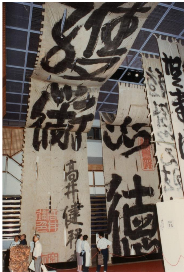
写真:「鴻山大幟展」(昭和 62 年 春のイベント)

本年は、おぶせ春・秋のイベントが始まっ て 30 周年の記念すべき節目の年に当たりま す。今回の展示では、数々のイベントを振り 返りながら、小布施人が創造してきた新たな まちづくりの軌跡を辿ります。