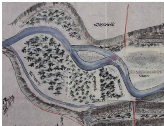
写真:安政 6(1859)年 8 月 松川の普請図面(平松家文書)