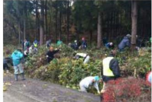
緩衝帯整備の様子

近年の、イノシシやサルの個体数増加による農林産物への被害を抑えるため、小布施町農作物有害鳥獣駆除推進協議会等を通じて、迅速な捕獲体制を強化し個体数の調整を図るとともに、侵入防止柵の設置、維持管理や荒廃した里山林の整備を行い「緩衝帯」を作るなど、野生鳥獣を集落周辺に近づけさせない対策を推進していきます。