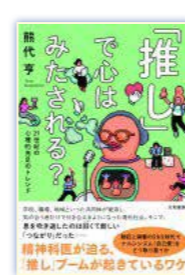
『推し』で心はみたされる?』 熊代亨・著