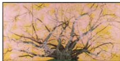
中島千波 「素桜神社の神代櫻」