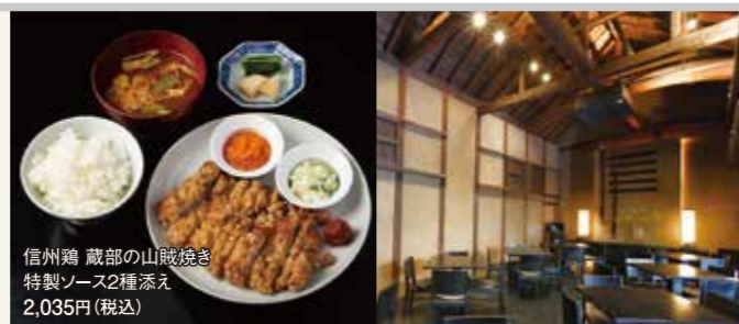
信州鶏 蔵部の山賊焼き 特製ソース2種添え 2,035円(税込)

寄り付き料理と団欒のひとときを歴史ある酒蔵を用いた趣のある空間でお過ごしください。