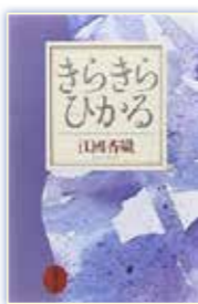
『きらきらひかる』 江國香織・著

きらきら、どきどき、わくわく、きゅん。ときめきって、何とも言い表しがたい気持ちですね。恋愛、きれいなもの、憧れの存在…。皆さんはどんなものに心が弾みますか。いつもの毎日にときめきを少しプラスすれば、日常がちょっときらめくはず。最近ときめきが足りていないかも?というあなた、本でときめきを感じてみませんか。