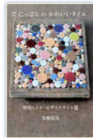
『につぼんのかわいいタイトル』 ル昭和レトロ・モザイクイラスト 加藤郁美・著