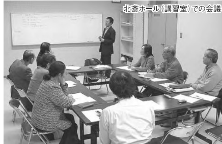
北斎ホール(講習室)での会議