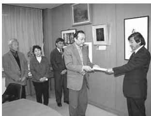
町長に提言書を手渡す小山会長

去る12月16日、さっそく青パトに音響機材などが設置されました。私たちが皆さんと、いっしょに、町の中でいつでもどこでも安心できるように見守っていきます。