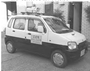
音響機材が設置された青パト