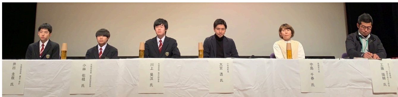
写真は2月の給食イベントより

今年2月「映画『夢みる給食』上映会&お話し会」の実施をきっかけに、まちづくり委員会の中で学校給食について、もっと考えていこうという気運が高まり、準部会という形で「給食を考える会」を発足しました。具体的な活動はまだこれからですが、子ども達の健康、食育、地消地産、あるいは学校給食が抱える問題をテーマに活動していきたいと考えています。現在参加者を募集中です！