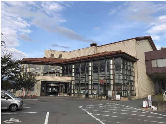
写真⑤ 勤労青年ホーム棟