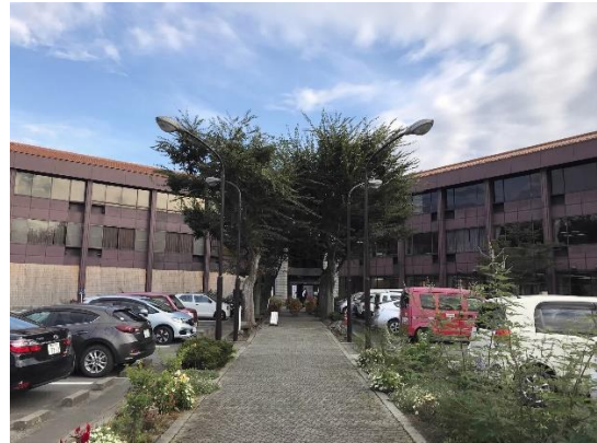
写真① 庁舎玄関前全景