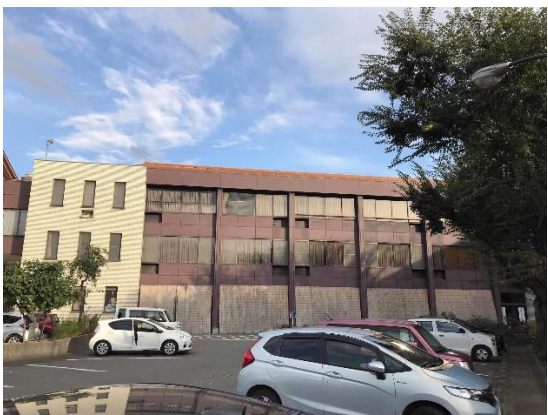
写真④ 保健センター棟